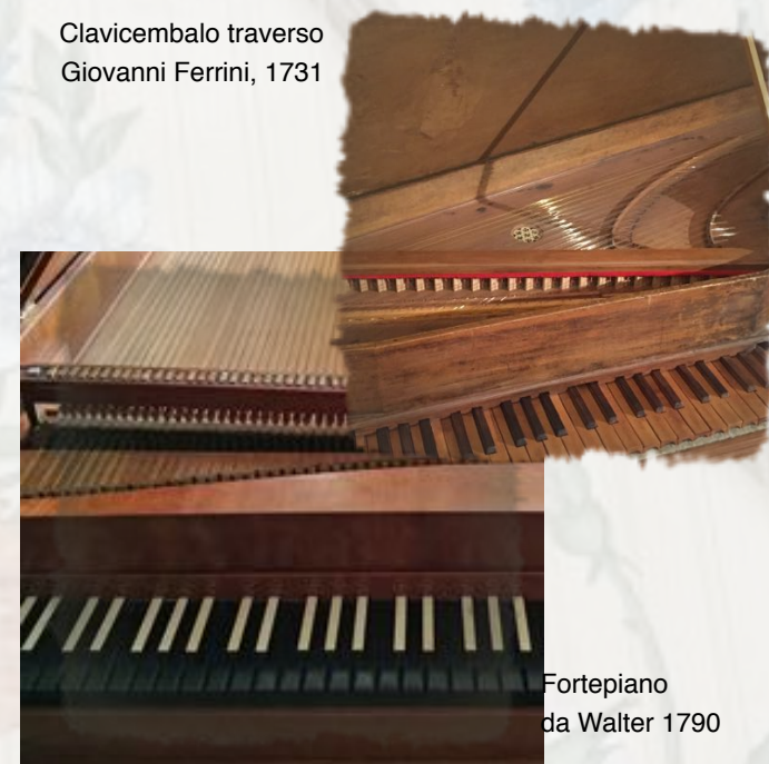
Fortepiano da Walter 1790

Clavicembalo traverso Giovanni Ferrini, 1731